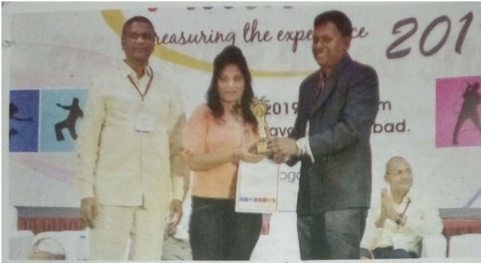
ARORA PG COLLEGE ANUBHUTI-2019